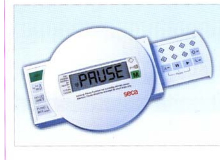
EPU SECA 435/434